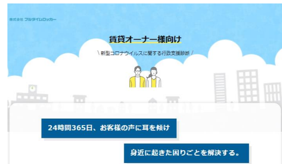
【新型コロナウイルスに関する支援診断サイト】

そこで当社は、いつでもどこでも簡単に、どんな支援策があるのか、どこでどんな手続きを行えば支援を受けられるのか、支援対象か否かを判定し、結果を一覧表示する診断サイトを開発しました。